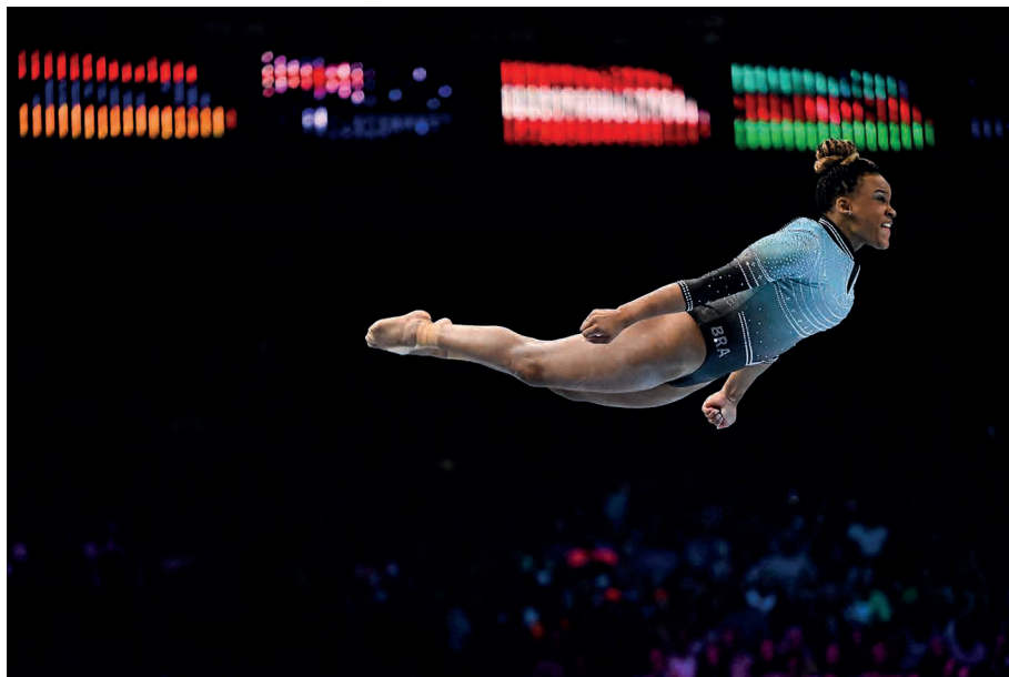
Rebeca Andrade, do Brasil, compete durante o Campeonato Mundial de Ginástica Artística da FIG na Antuérpia, Bélgica.