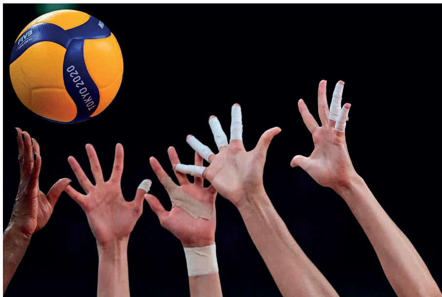
Jogadoras disputam a bola em uma partida de vôlei entre Brasil e Rússia durante os Jogos Olímpicos de Tóquio.