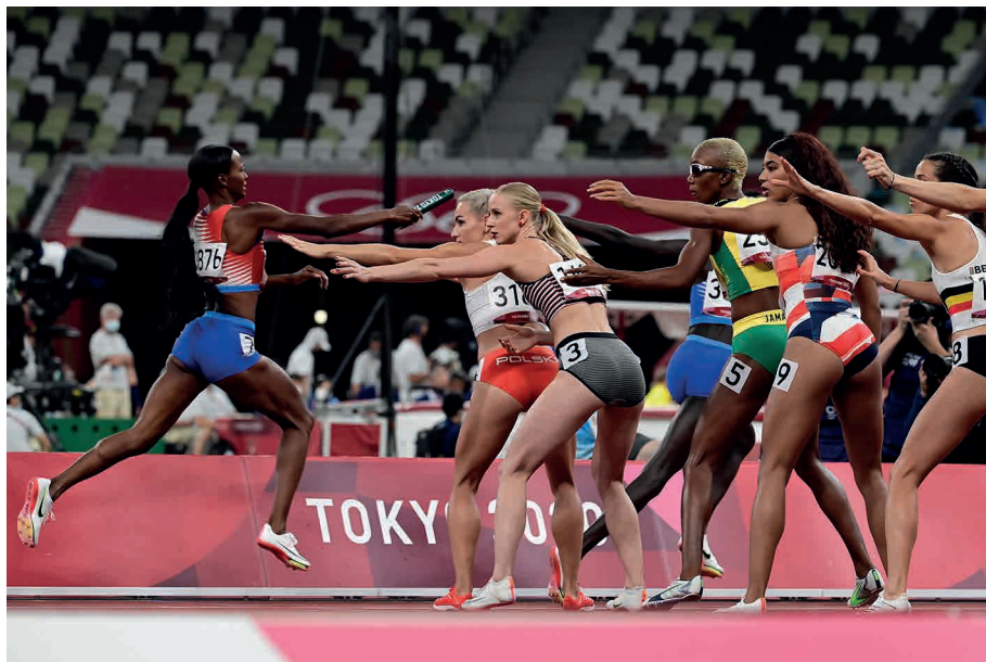
Atletas competem em prova de revezamento de bastão durante os Jogos Olímpicos de Tóquio.