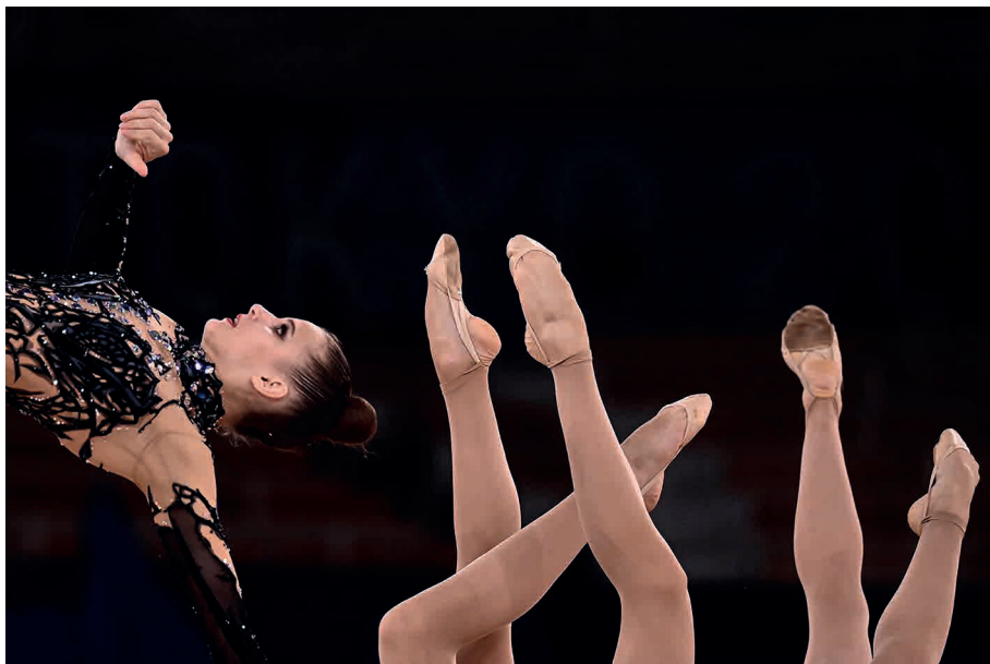
A equipe de ginástica rítmica da Ucrânia compete durante os Jogos Olímpicos de Tóquio.