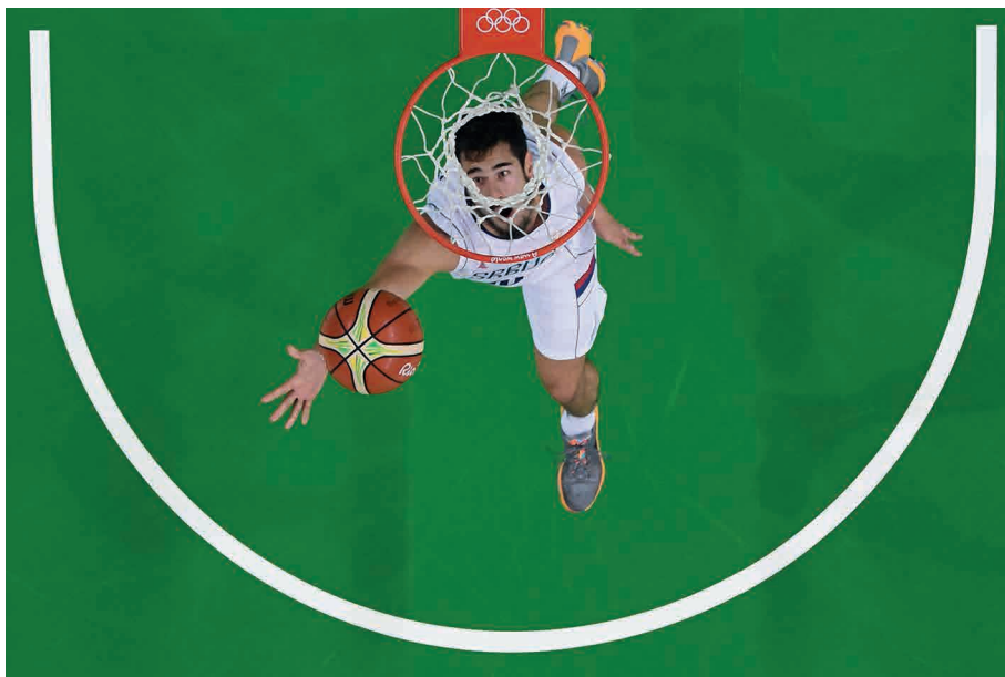
O pivô sérvio Nikola Kalinic sobe para pontuar em uma partida de basquete contra a China, durante os Jogos Olímpicos do Rio de Janeiro.