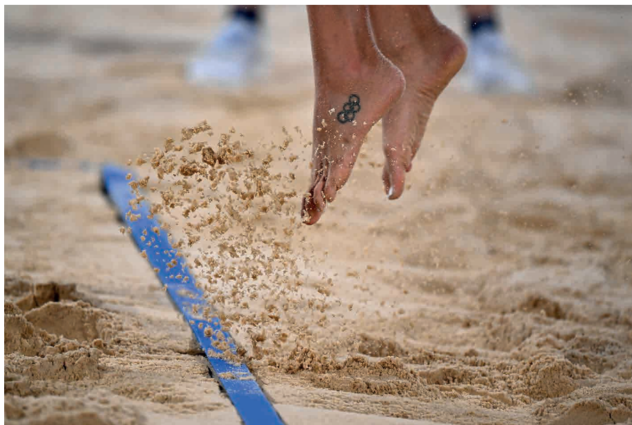
Uma jogadora de vôlei de praia compete em partida entre a Austrália e a Itália durante os Jogos Olímpicos de Tóquio.